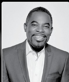
Frantz Benjamin Député de Viau